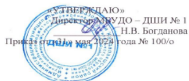
ГРАФИК ОБРАЗОВАТЕЛЬНОГО ПРОЦЕССА